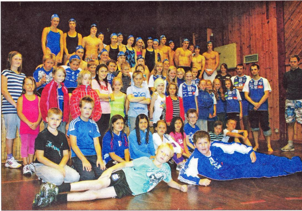
54 svømmere fra åtte til 18 år bodde i forrige uke på Sandgotna skole, hvor tiden gikk med til å trene i den nye svømmehallen.